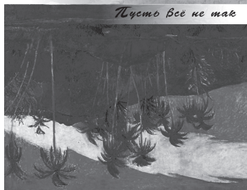
Пусть всё не так