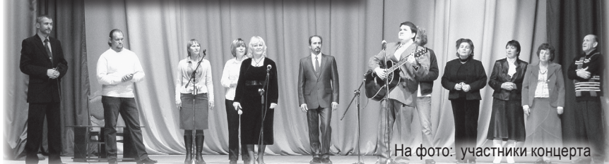
На фото: участники концерта