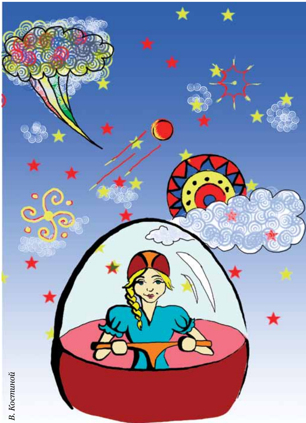
Рис. В. Костинной