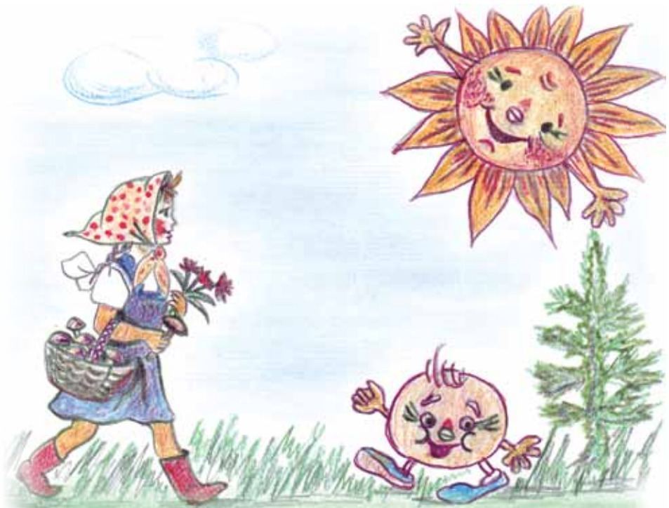
Рис. В. Светловой

И сказала строго Нюшка – Внучка-непоседа: «Если будешь непослушным – Будешь нами съеден».