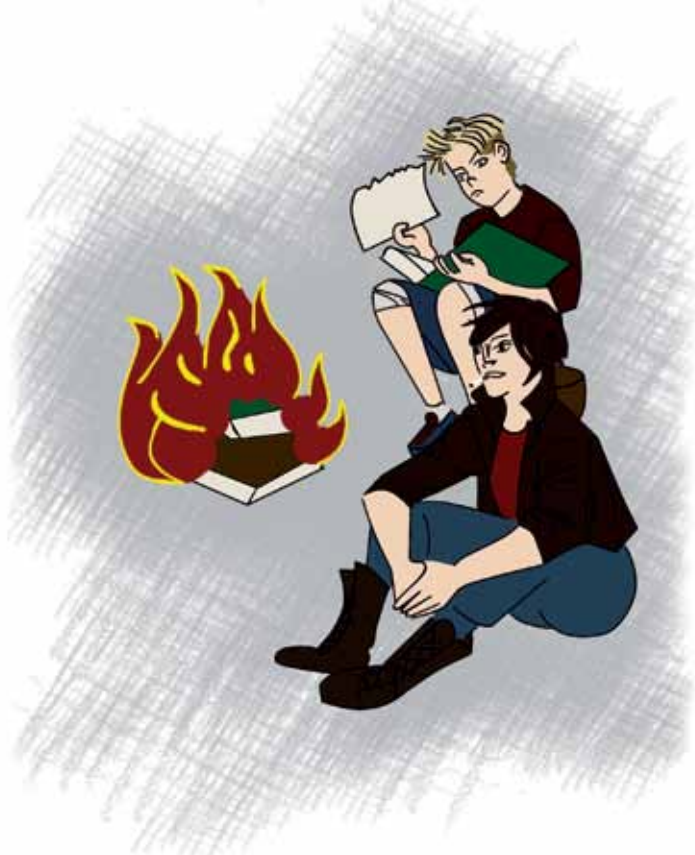
Рис. И. Лыковой

Два жутких лоботряса, Им лень всё познавать. Один любил гримасы, Другой на всё плевать.