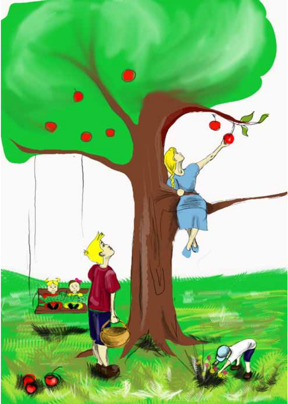
Рис. В. Костиной