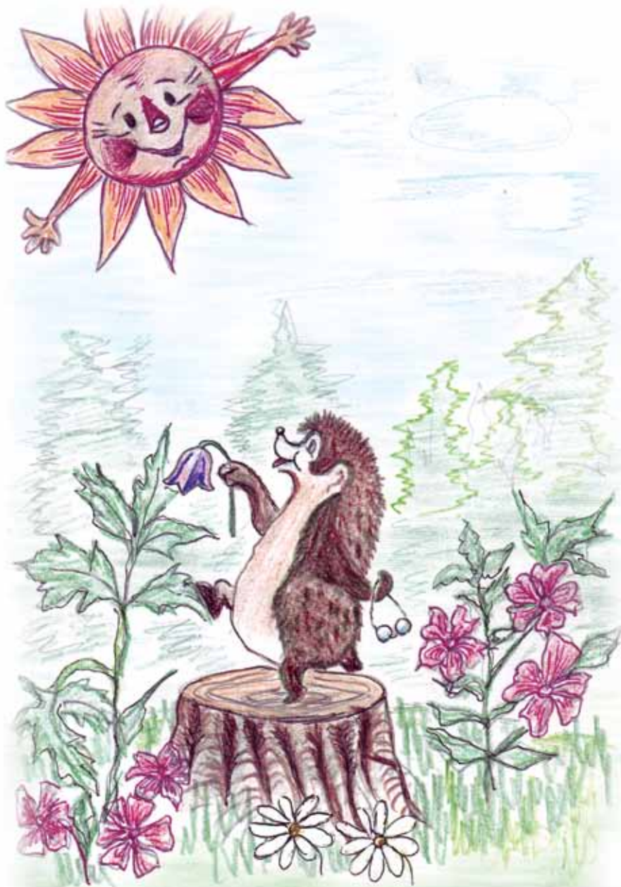
Рис. В. Светловой