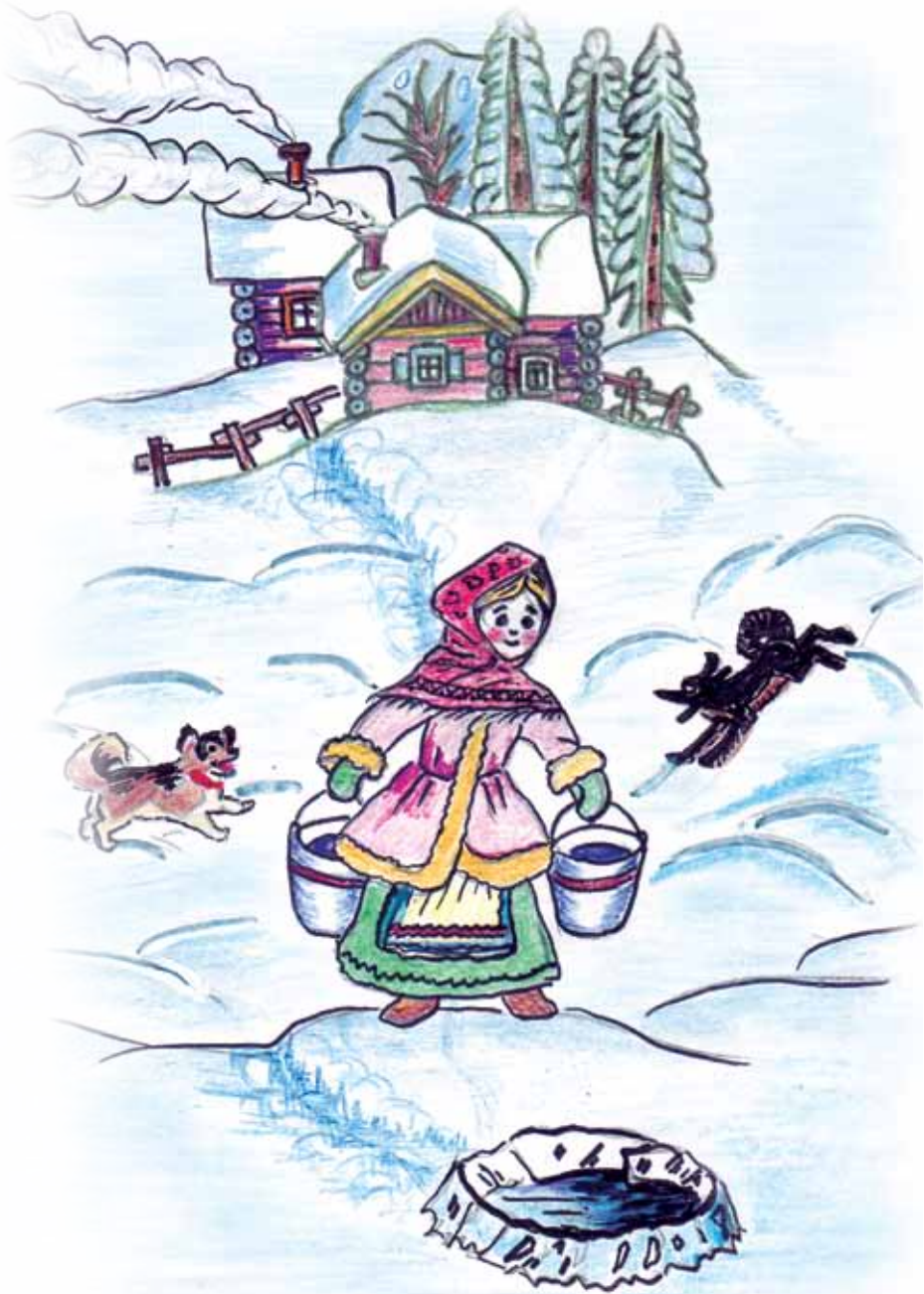
Рис. В. Светловой