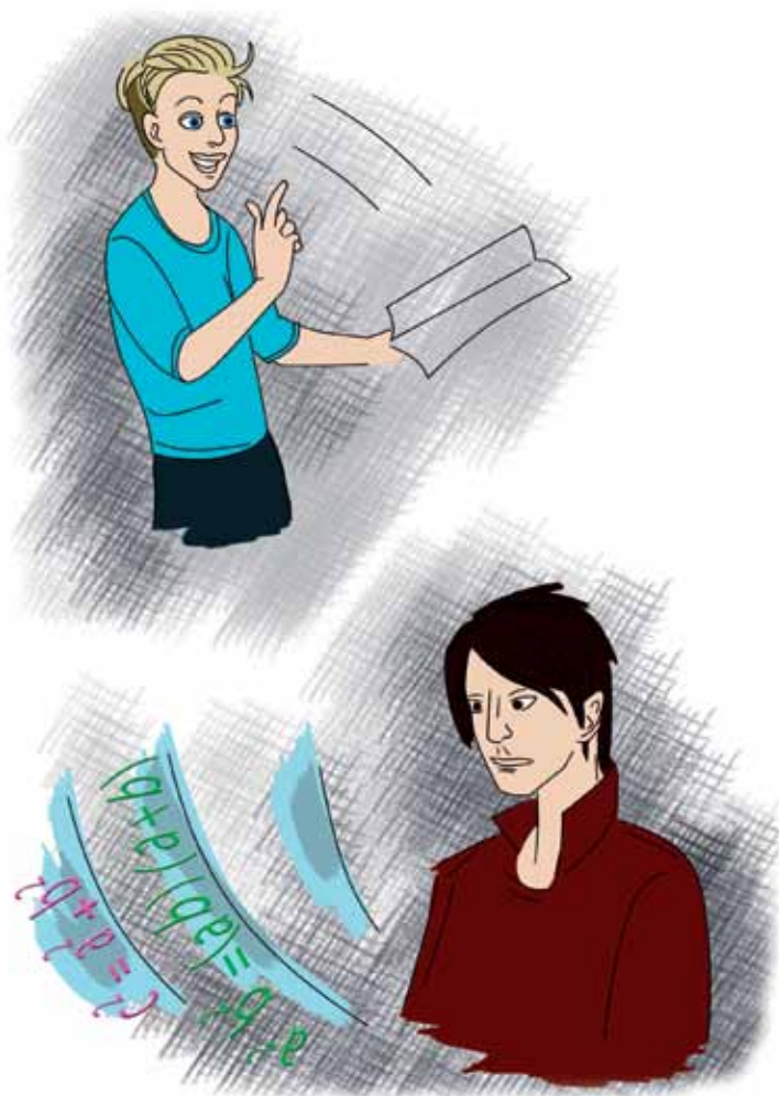
Рис. И. Лыковой

Мальчишка засмеялся: «Ну вот, корабль готов, Хотите прогуляться, В галактике миров?»