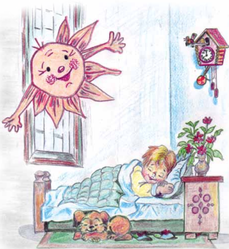
Рис. В. Светловой

На пруд побежал, лягушат стал он звать. «В прятки хотите со мной поиграть?» Вдруг солнце увидел в воде на пруду – Сказал: «Поиграю и скоро приду».