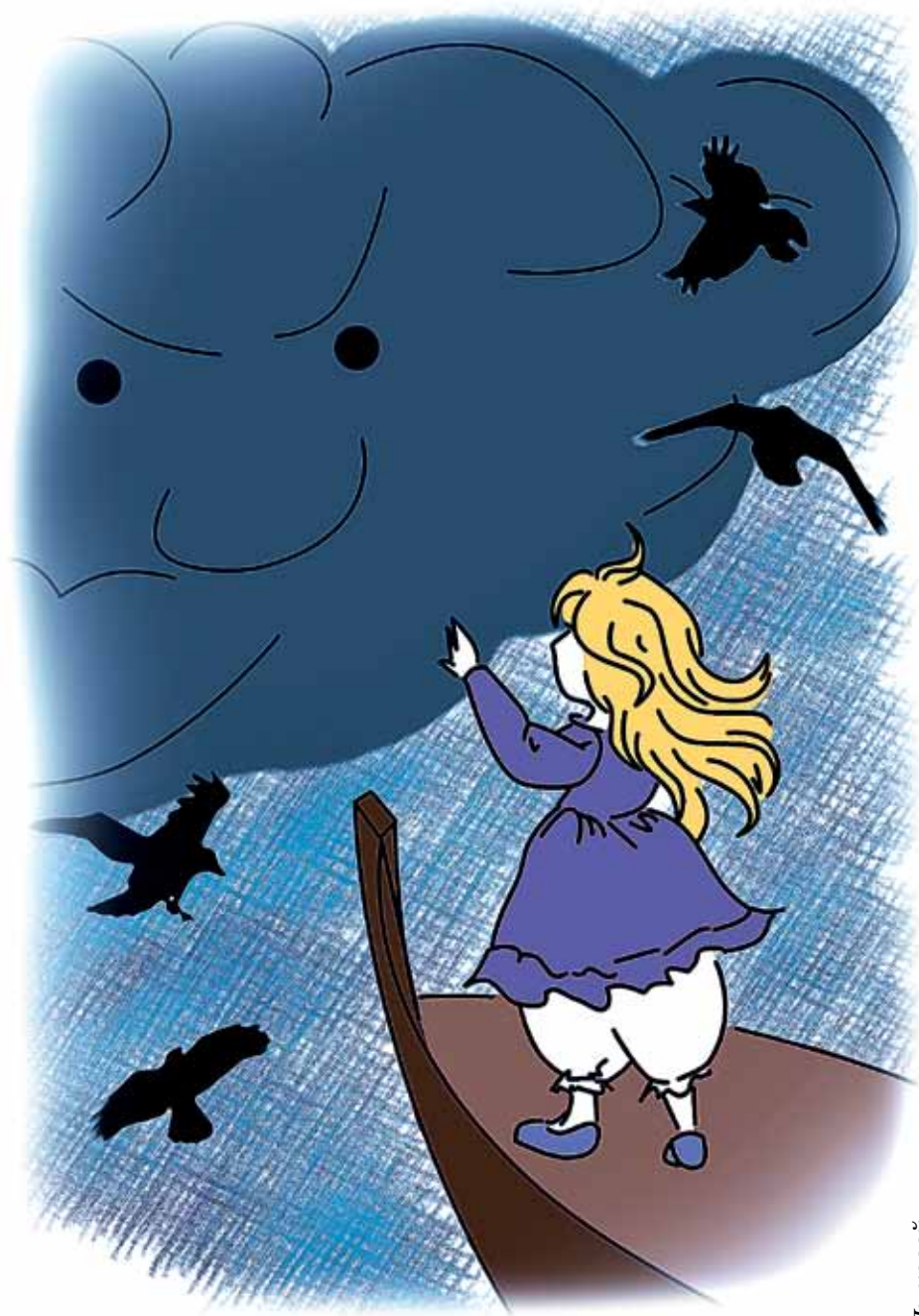
Рис. И. Лыковой