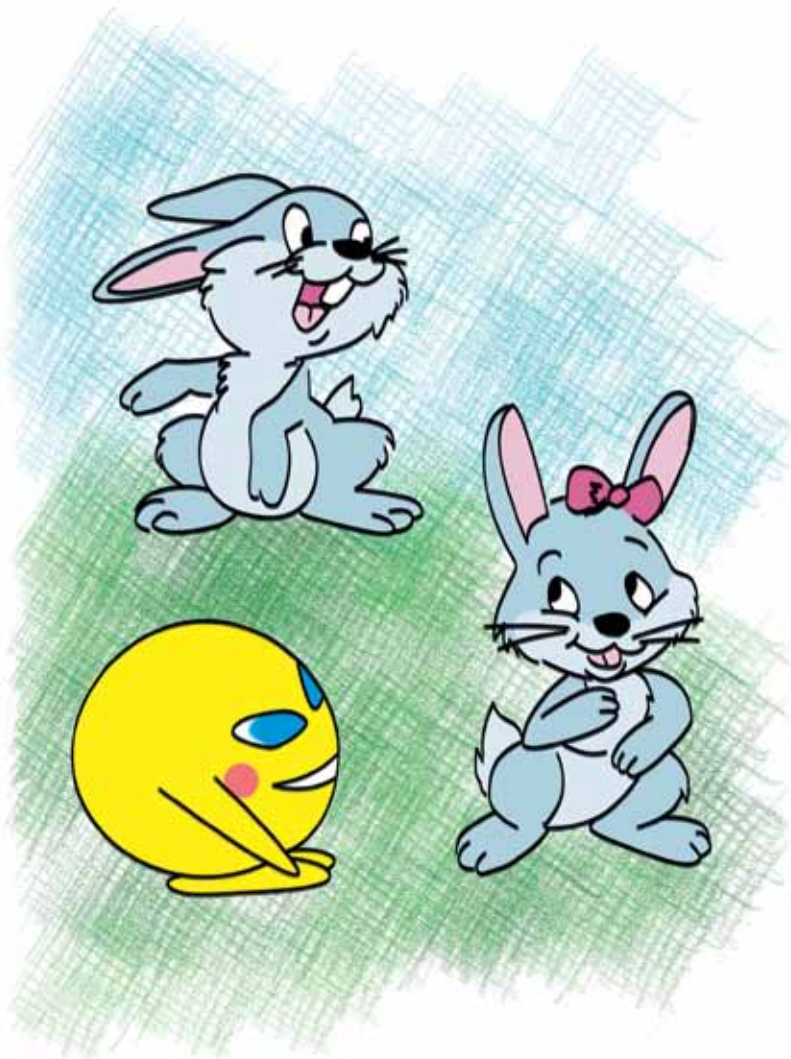
Рис. И. Лыковой

Колобок стал прыгать с ними – Лучший я прыгун. Его зайцы опустили – Нужен им хвастун.