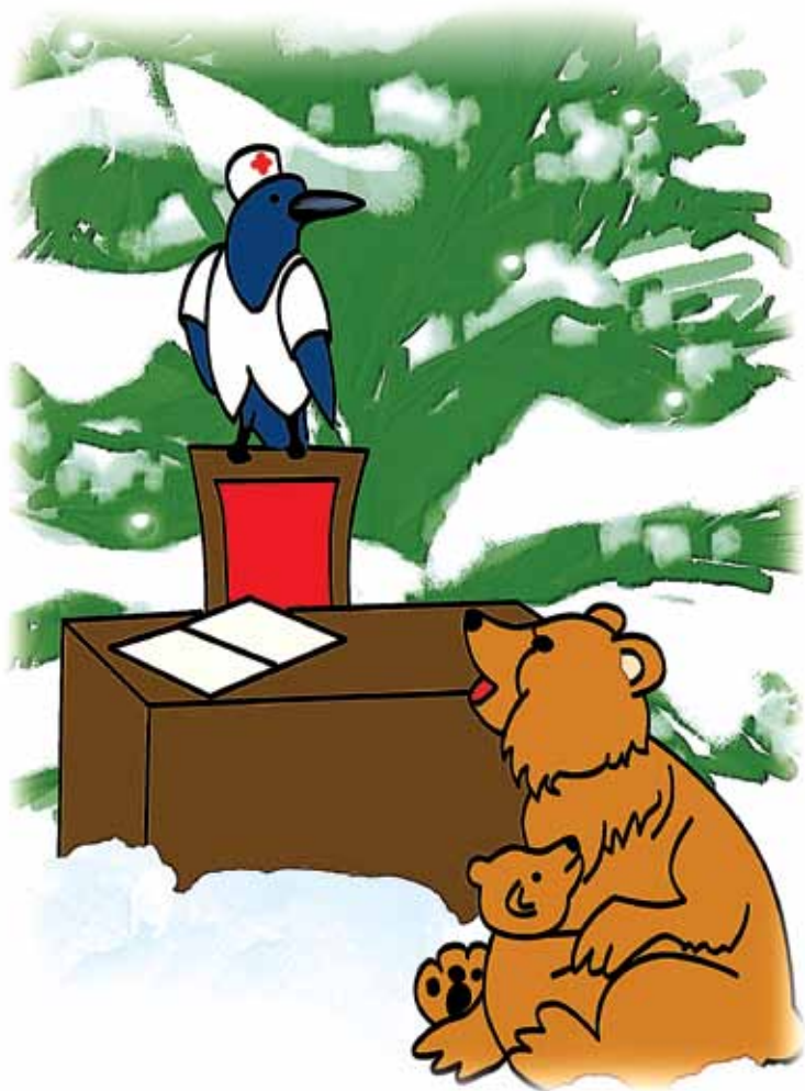
Рис. И. Лыковой