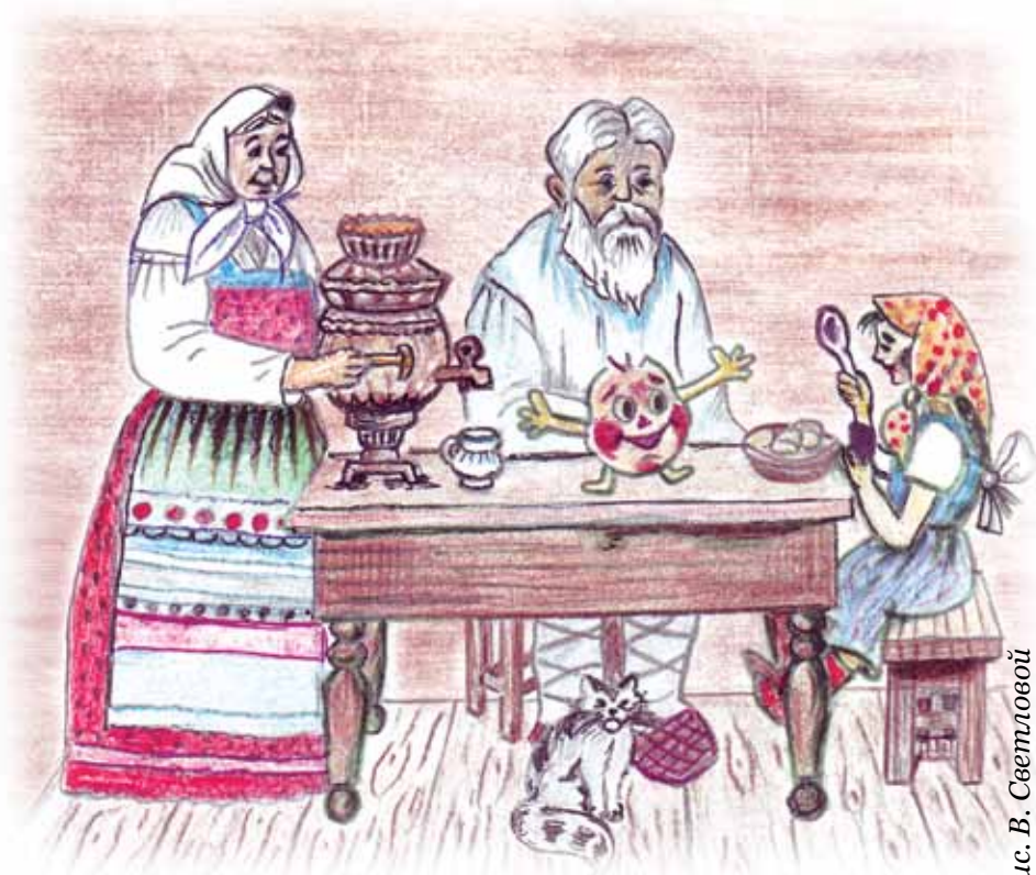
Рис. В. Светловой