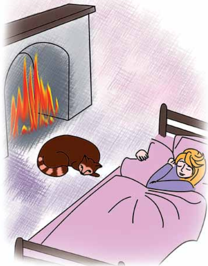
Рис. И. Лыковой

Декабрьским снежком замело всё кругом: Деревья, кусты и скамью за окном. Но в доме тепло и стоит тишина, И Маша хозяйка сегодня одна.