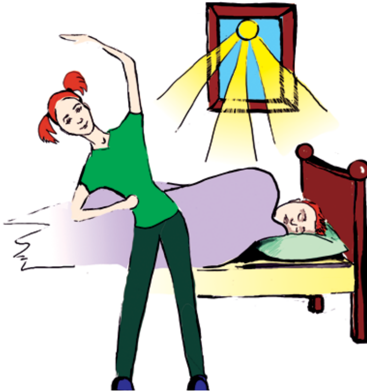
Рис. В. Костиной