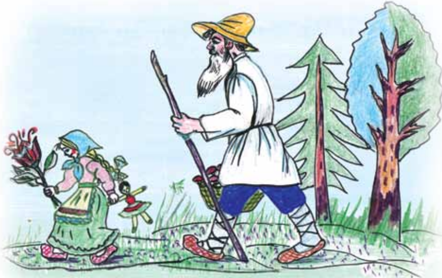
Рис. В. Светловой